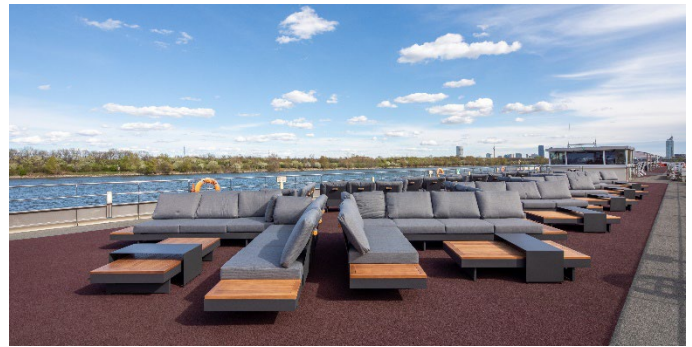
MS Nestroy, Lounge Sonnendeck

*) Abhängig von der politischen Entwicklung in der Ukraine kann das Programm im Donaudelta gegebenenfalls angepasst und alternativ ab/bis z.B. Braila (ca. 100 km entfernt) durchgeführt werden. Die endgültige Entscheidung hierüber kann auch noch während der Kreuzfahrt durch den Kapitän getroffen werden.