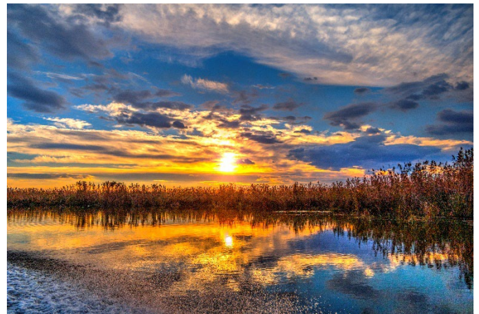
Donaudelta bei Sonnenuntergang