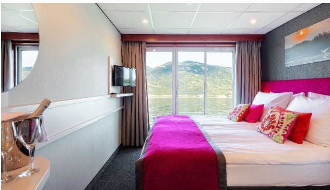
MS Nestroy, Doppelkabine Schiller- / Goethedeck

Änderungen des Reiseverlaufs und Ausflugsprogramm bleiben seitens der Reederei vorbehalten. Bitte beachten Sie, dass es aufgrund von Niedrig-/Hochwasser zu unvorhergesehenen Wartezeiten bei den Schleusen oder auch aufgrund von Witterungsbedingungen zu Verspätungen und daher zu Änderungen des Ausflugsprogramms oder ev. auch der Ein-/Ausstiegstellen kommen kann. Ebenso behält sich die Reederei das Recht vor, die Gäste, insbesondere infolge von Niedrig-/Hochwasser oder Schiffsdefekt, alternativ zu befördern bzw. unterzubringen (z.B. mit Bussen bzw. in Hotels) und allenfalls den Streckenverlauf zu ändern; unter Umständen ist auch der Umstieg auf ein anderes Schiff erforderlich.