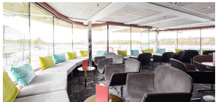
MS Nestroy, Panoramabar

*) Abhängig von der politischen Entwicklung in der Ukraine kann das Programm im Donaudelta gegebenenfalls angepasst und alternativ ab/bis z.B. Braila (ca. 100 km entfernt) durchgeführt werden. Die endgültige Entscheidung hierüber kann auch noch während der Kreuzfahrt durch den Kapitän getroffen werden.