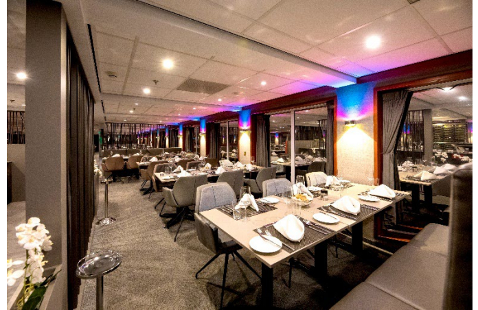
MS Nestroy, Restaurant