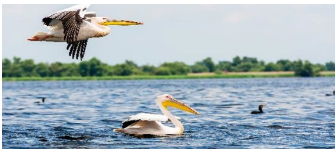
Pelikane im Donaudelta