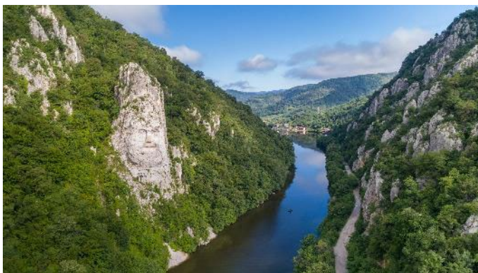
Eisernes Tor mit Decebal